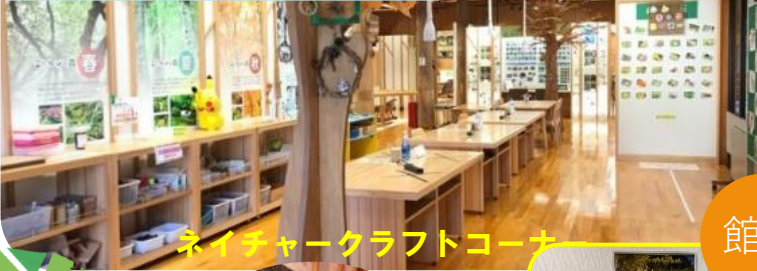
ネイチャークラフトコーナー